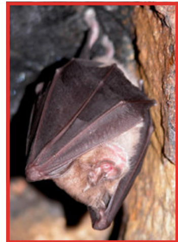
Le Grand Rhinolophe ( Rhinolophus ferrumequinum )