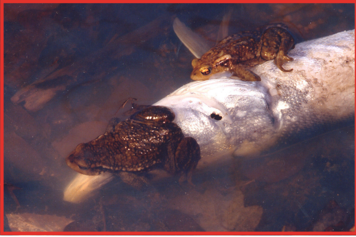
La photographie des ébats amoureux