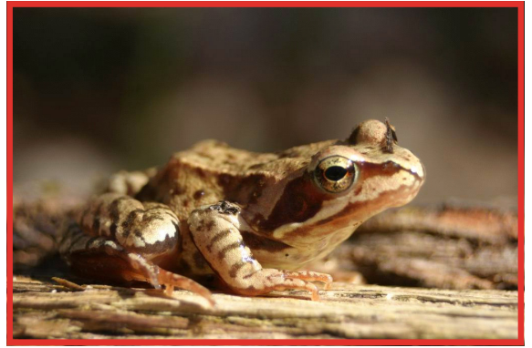
La Grenouille rousse Photo : S. GUIBERT Photo :