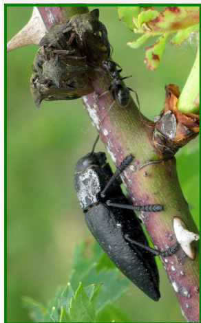
Le Capnode Capnodis tenebrionis