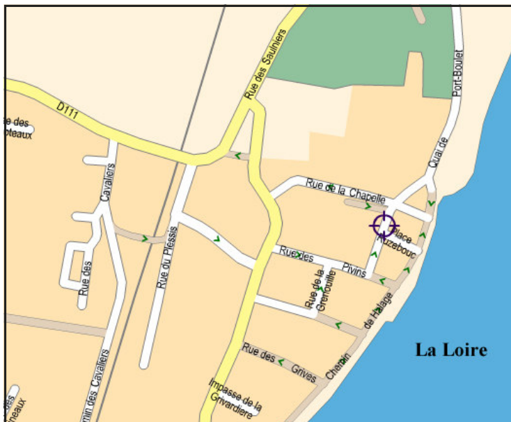
Plan du Local LPO à La Pointe/Bouchemaine