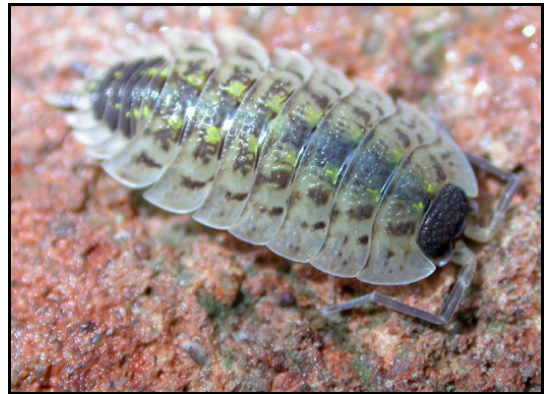
Porcellio spinicornis

Les données contemporaines (après 1990) font actuellement état de la présence d'au moins 28 espèces dans le département, soit au total 29 espèces observées depuis 1872.